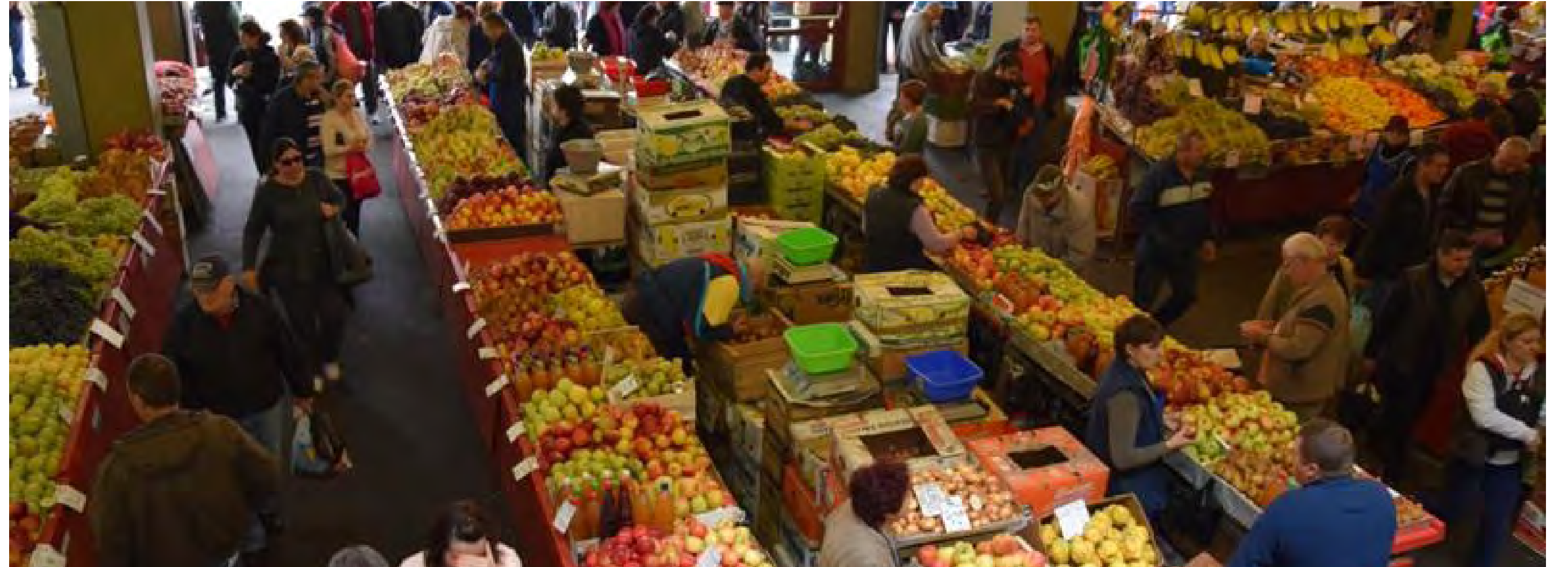
Romania, Piața Obor