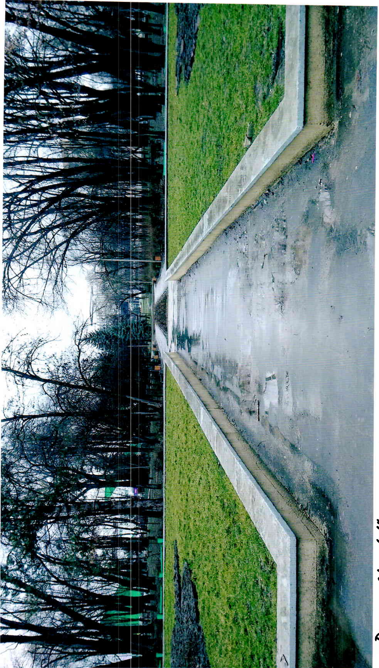
Parcul „Alunelul” - in prezent - martie 2018