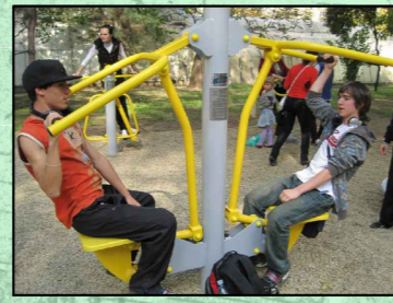
teren sportiv pentru adulti