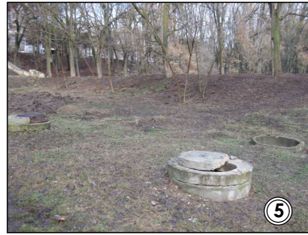
camera de revizuire S.A. "Termocom"