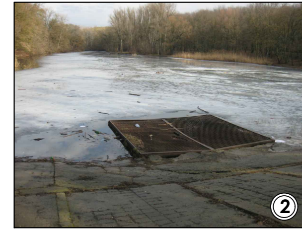
grila de colectare a surplusului de ape