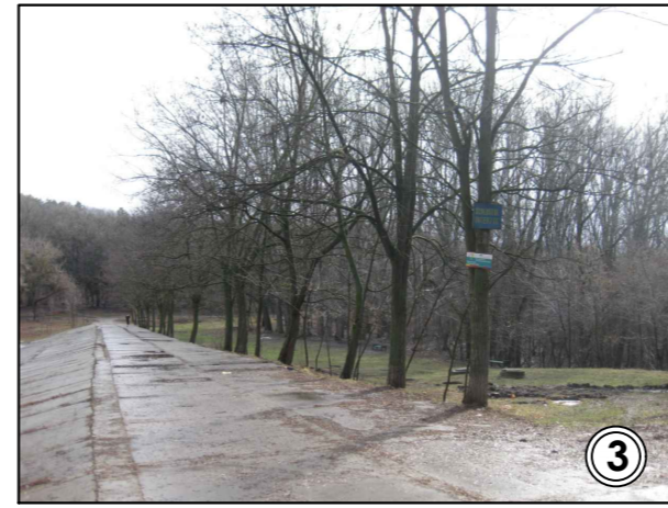
dig de protectie