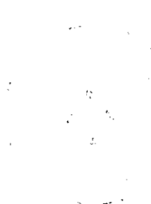
Nuška Gajšek, mayor City Municipality Ptuj