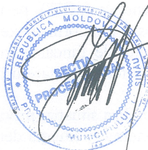
Ilie CEBAN VICEPRIMAR

6. Controlul îndeplinirii prezentei dispoziții mi-l asum.